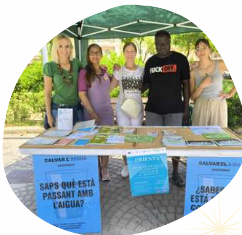
DÍA INTERNACIONAL POR EL MEDIO AMBIENTE Taula Comunitària de Foners