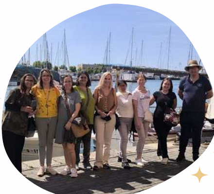
Visita guiada a la LONJA DEL PESCADO