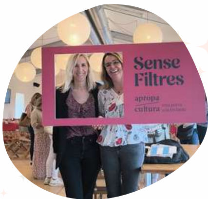
Acto de presentación campana Parlem-ne sense filtres Apropa Cultura