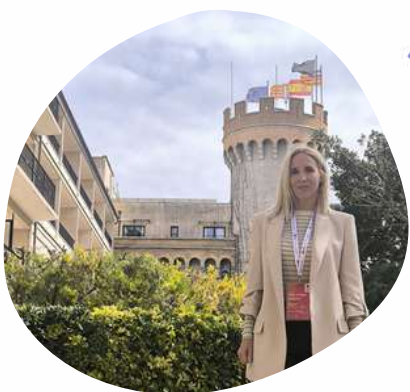
Acto de presentación del Centro Especial de Empleo de MITIE