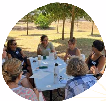
Participación en Jornadas Intersección 4 APROPA CULTURA