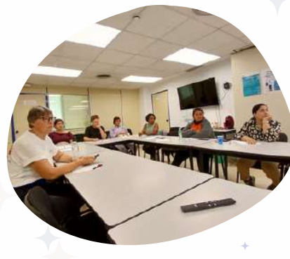
Taller de SALUD MENTAL y Empleabilidad con Asociación GIRA-SOL