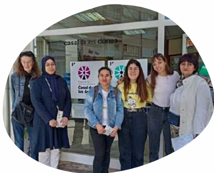
Visita guiada al CASAL DE LES DONES

Otras actividades realizadas junto a entidades y empresas desde la Comunidad Orienta. Nuestra comunidad participa activamente en cada iniciativa.