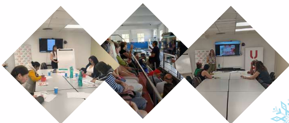
Nº de personas participantes en talleres ORIENTA 2025

Podéis consultar los datos detallados en el INFORME COMPLETO DE RESULTADOS del PROGRAMA en la WEB orienta.usoib.es a partir del 17 de diciembre