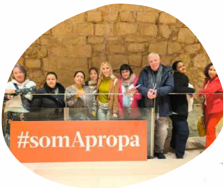
APROPA CULTURA - Acto de presentación programación cultural primavera/verano 2025