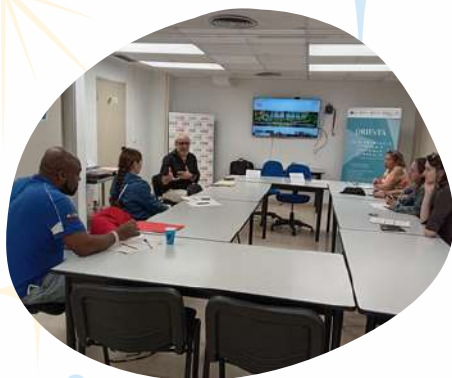
Taller de Prevención contra el Racismo de la mano de Cruz Roja