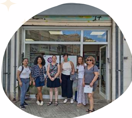
Visitas guiadas al Casal de les Dones