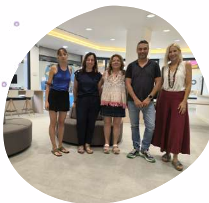
Visita al Centro de Orientación, Emprendimiento, Acompañamiento e Innovación para el Empleo de Balears (COE Balears)