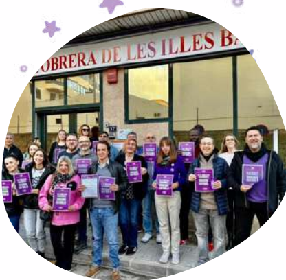
Día Internacional contra la Violencia Machista