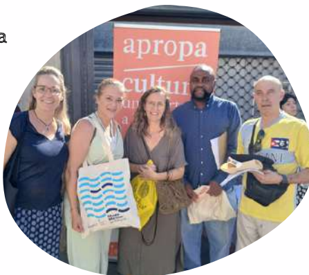
APROPA CULTURA Acto de presentación programación cultural 2025