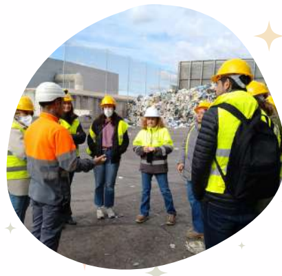
Visitas a FUNDACIÓN DEIXALLES