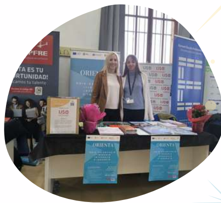
III FERIA DE EMPLEO Y FORMACIÓN Mancomunitat Pla de Mallorca