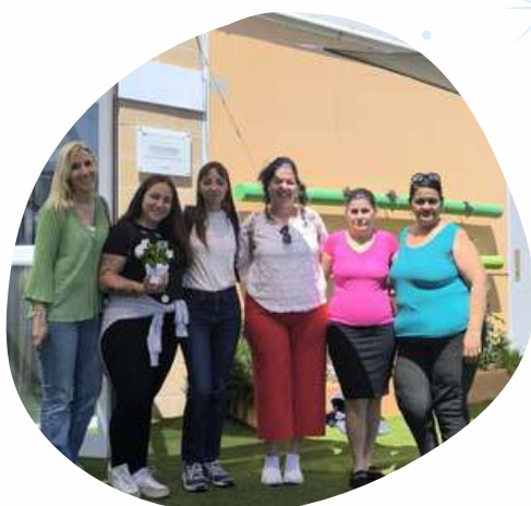
Visita guiada a AMADIBA CENTRO DE FORMACIÓN