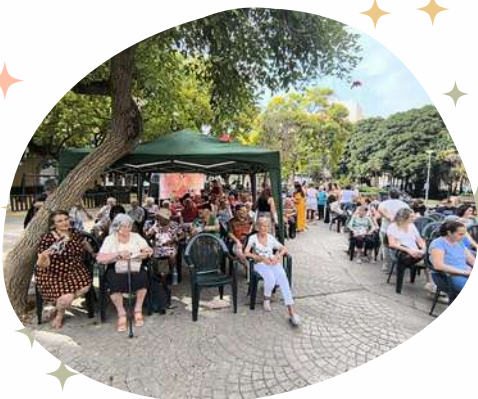
Actividad por el Día Mundial contra el Maltrato de las personas MAYORES Taula Comunitària de Foners