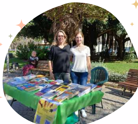
Celebración del Día Internacional del LIBRO