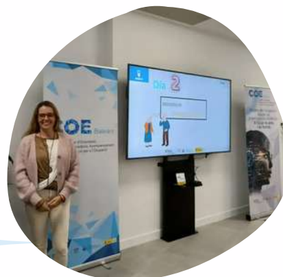
Participación en las jornadas INTEREXIT Organizadas por el COE-Balears